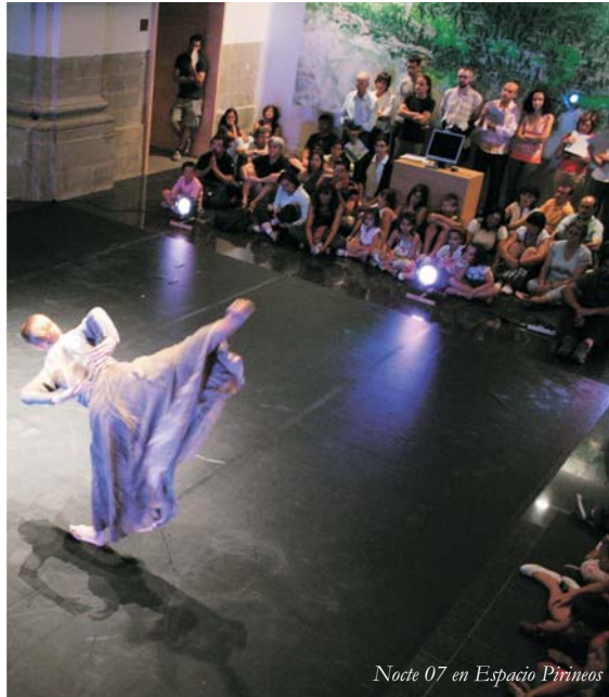
Noche 07 en Espacio Pirineos