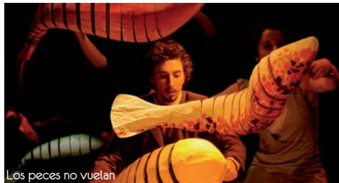
Los peces no vuelan

Por la compañía chilena La Mona Ilustre ( www.lamonailustre.com ) Entrada: 3€ Con tarjeta RAEE: 2€