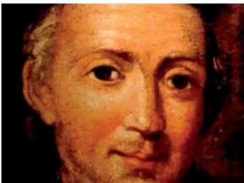
EN PORTADA: Retrato de Baltasar Gracián, propiedad de la Parroquia de Graus y expuesto en Espacio Pirineos

Edita: Ayto. de Graus. Área de Cultura