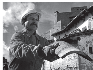
Con fotografías de Jacques Valat.

De martes a sábado de 11 a 14 y de 17 a 21 horas.