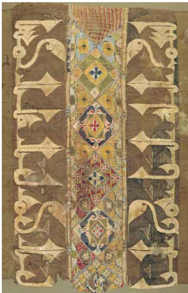
TIRAZ DE COLLIS. Museo de Huesca.

EL FESTIVAL DE LA RIBAGORZA necesita TU AYUDA para continuar Un donativo: un paso hacia la continuidad