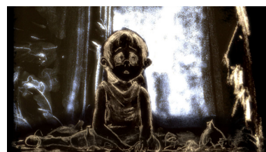
La historia de Eli