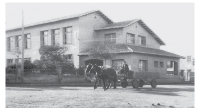
Mi escuela tiempo después

Antiguos y actuales alumnos, así como relevantes expertos en el ámbito de la educación testimonian sobre esta cuestión a lo largo del documental.