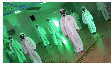
Experimento de fábrica

La verdadera y auténtica amenaza a la sociedad va mucho más allá de lo que se ve y que a simple vista puede resultar. Un héroe anónimo se adentra en lo que parece un mundo paralelo inexistente y que los demás no perciben. Decide poner en marcha un plan decisivo para poder llevar esa consciencia al resto de la humanidad.